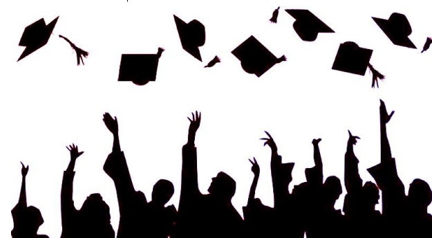
Photo de famille