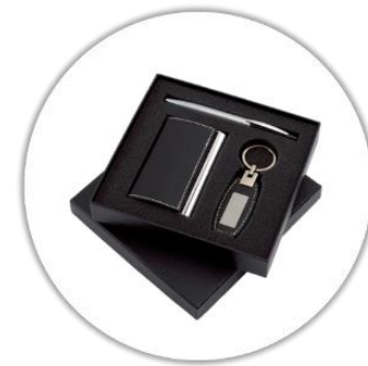
Coffret (porte carte de visite, stylo de luxe et porte clé en cuir) avec votre nom complet gravé au laser*