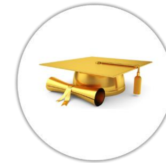
Attestation / Certificat de fin