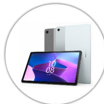
Tablette numérique avec clavier & pochette*