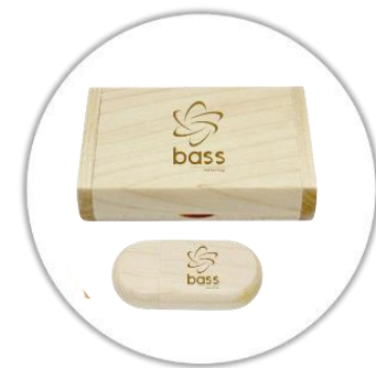
Clé USB 3.0 en bois gravé au laser