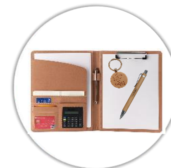
Conférencier avec calculatrice & stylo